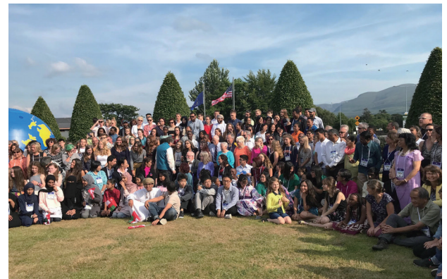
アイルランドで開催された GLOBE 国際生徒会議における 成果発表・交流の様子