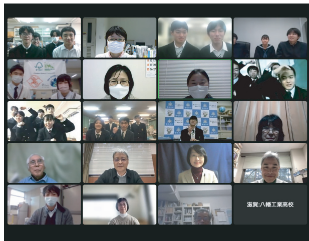
生徒の集いの様子

全国のグローブスクールが集まり、各学校の観測・研究の成果を発表する機会を設けています。全国の様々な地域の研究発表を聞くことで、地域環境の特性や多様性を知り、自身の調査地と比較して考えることができます。発表では大学教員からの評価やコメントが得られ、次の活動へフィードバックすることができます。また、同じ観測をしている仲間の発表を聞いたり、情報交換を行うことで刺激を受けるとともに、全国の生徒との交流の機会を得ることができます。